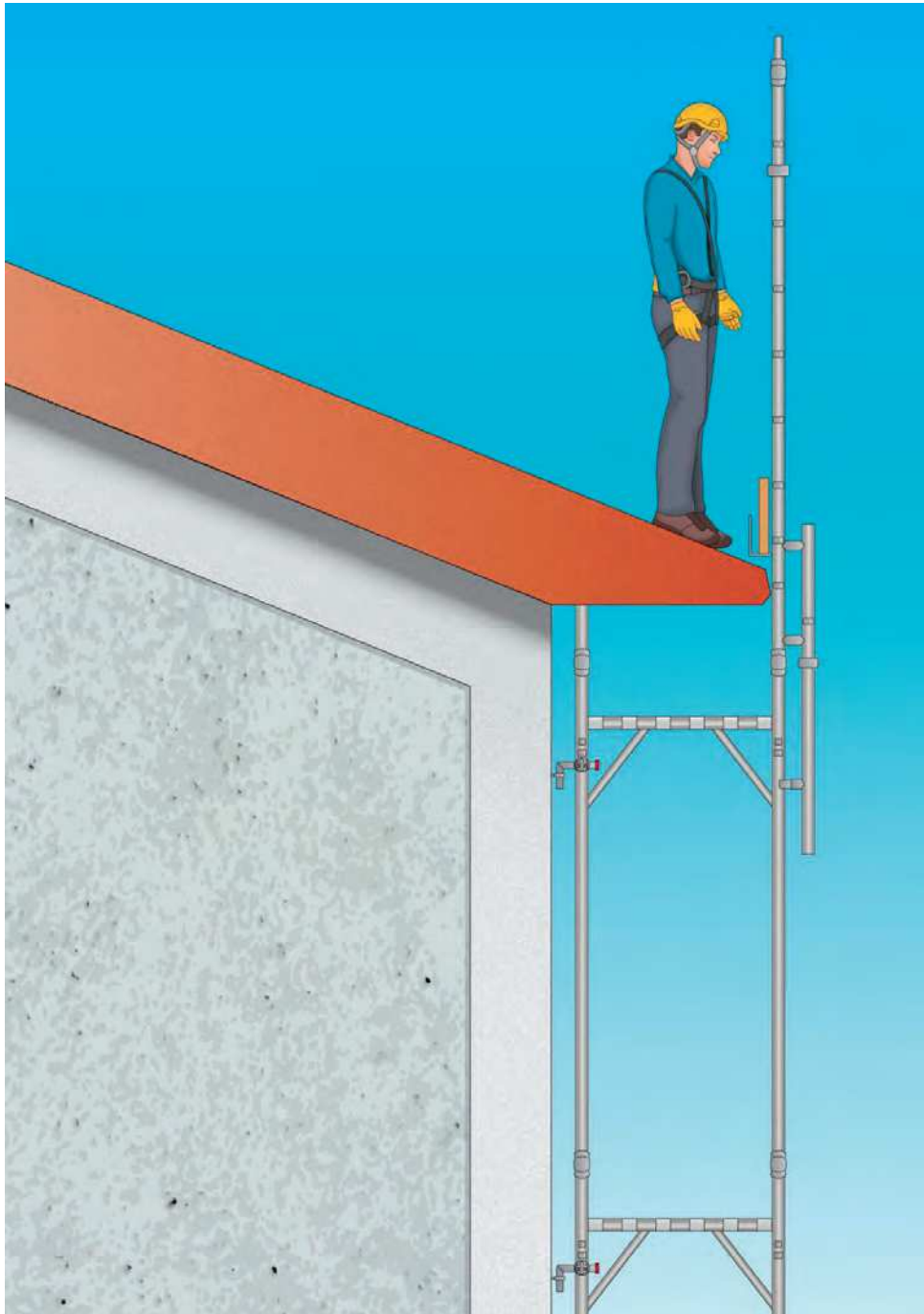
Figura 5 - Esempio di ponteggio utilizzato per la protezione dei bordi