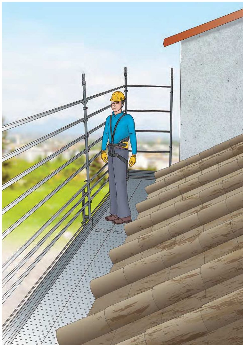
Figura 4 - Esempio di ponteggio utilizzato per la protezione dei bordi