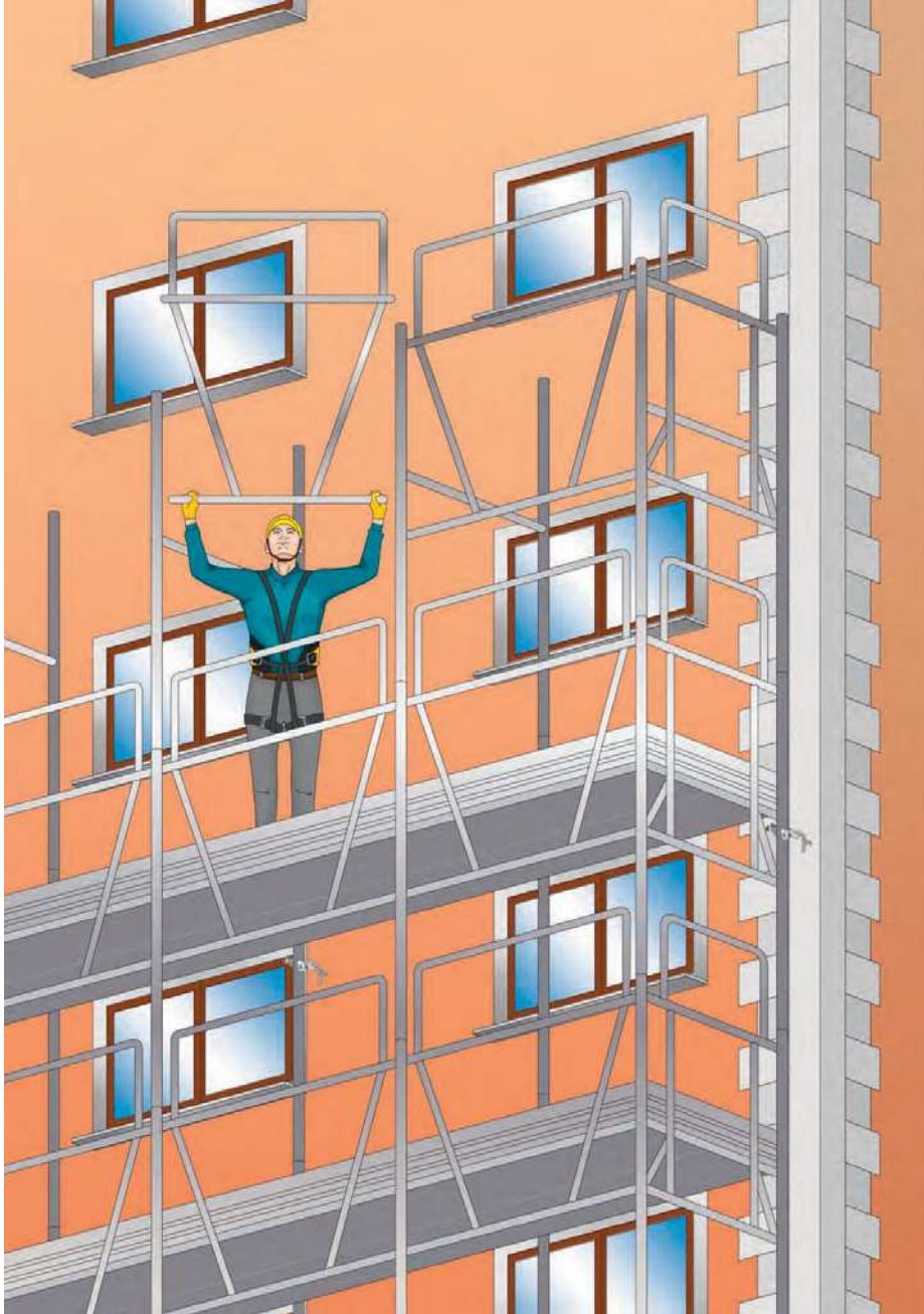
Figura 6 - Montaggio di un ponteggio con telaio parapetto (montaggio dal basso)