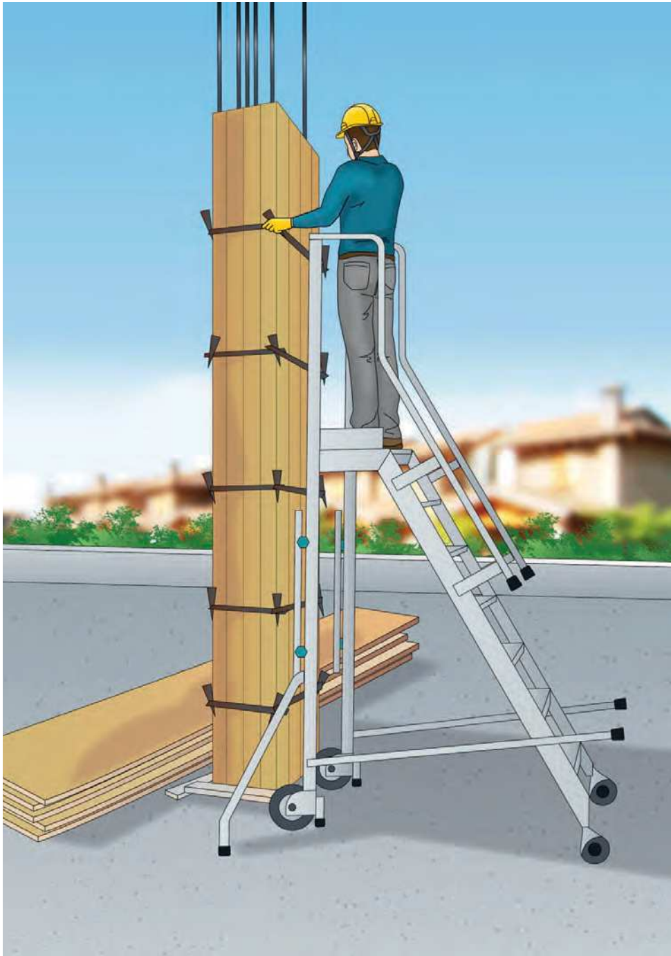
Figura 2 - Esempio di scala mobile con piattaforma, ai sensi della UNI EN 131-7