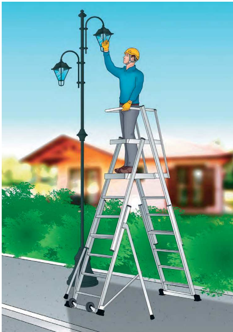
Figura 3 - Esempio di scala mobile con piattaforma, ai sensi della UNI EN 131-7