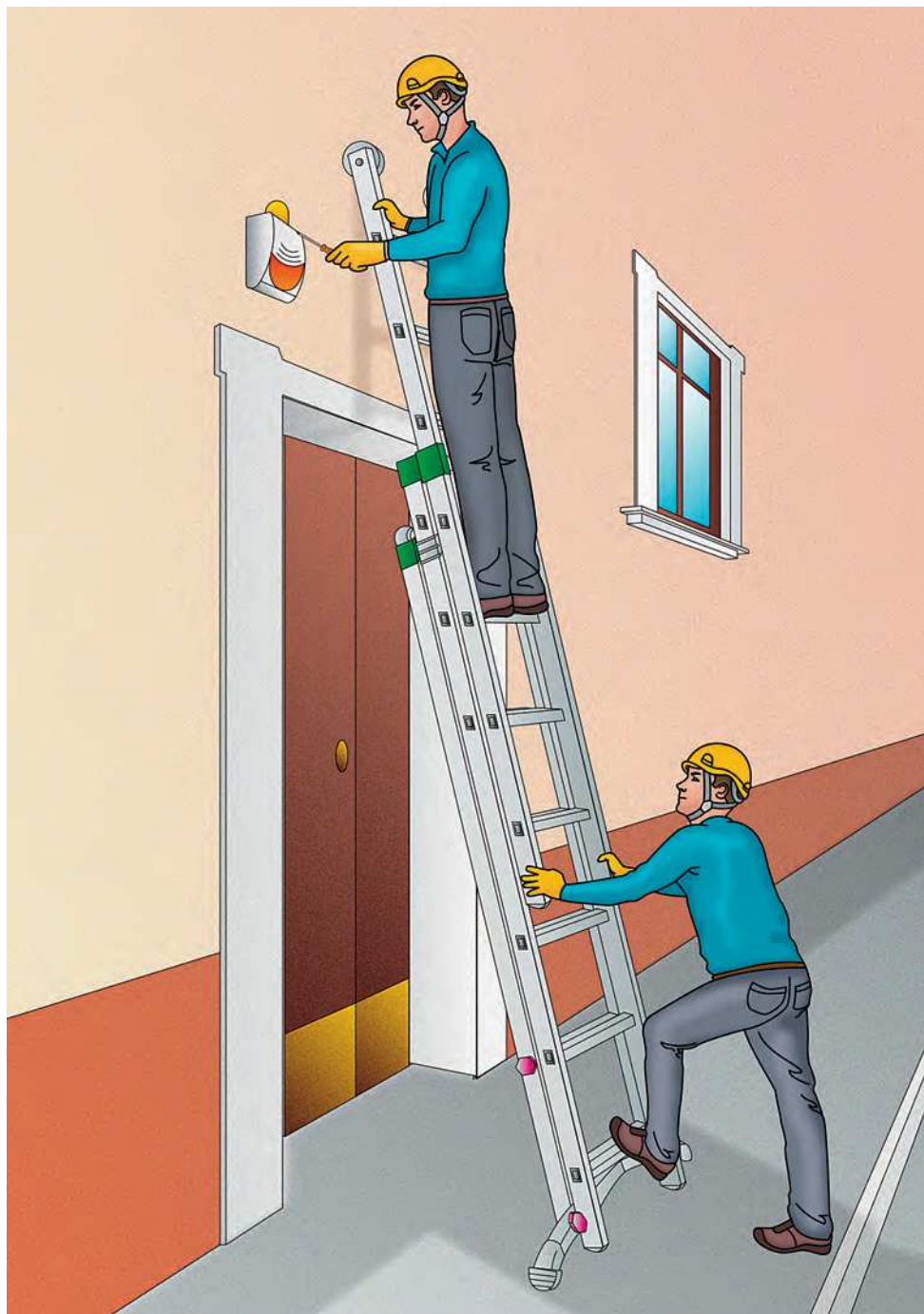
Figura 5 - Esempio di scala trasformabile a tre tronchi in configurazione di appoggio