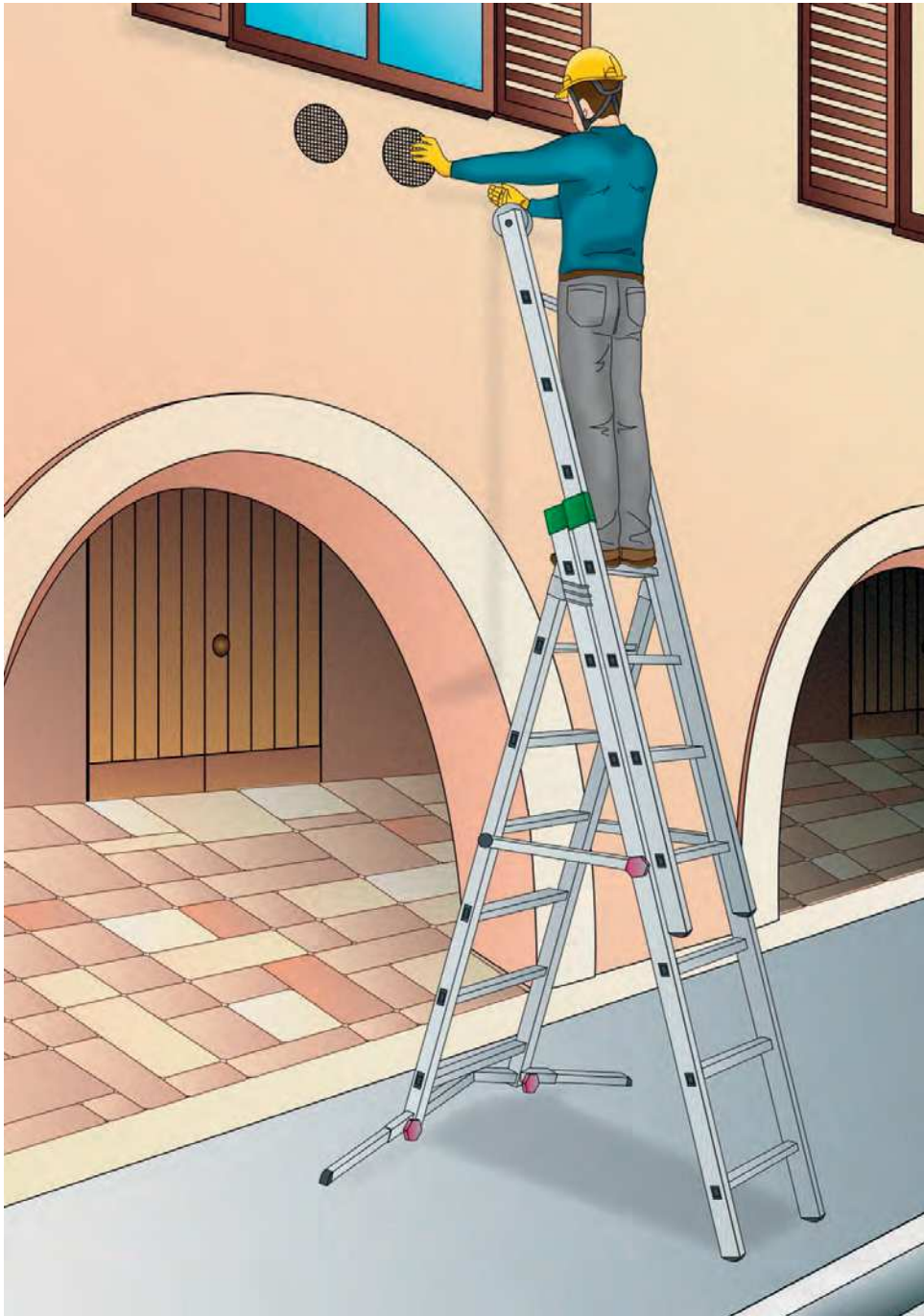
Figura 1 - Esempio di scala trasformabile a tre tronchi in configurazione doppia