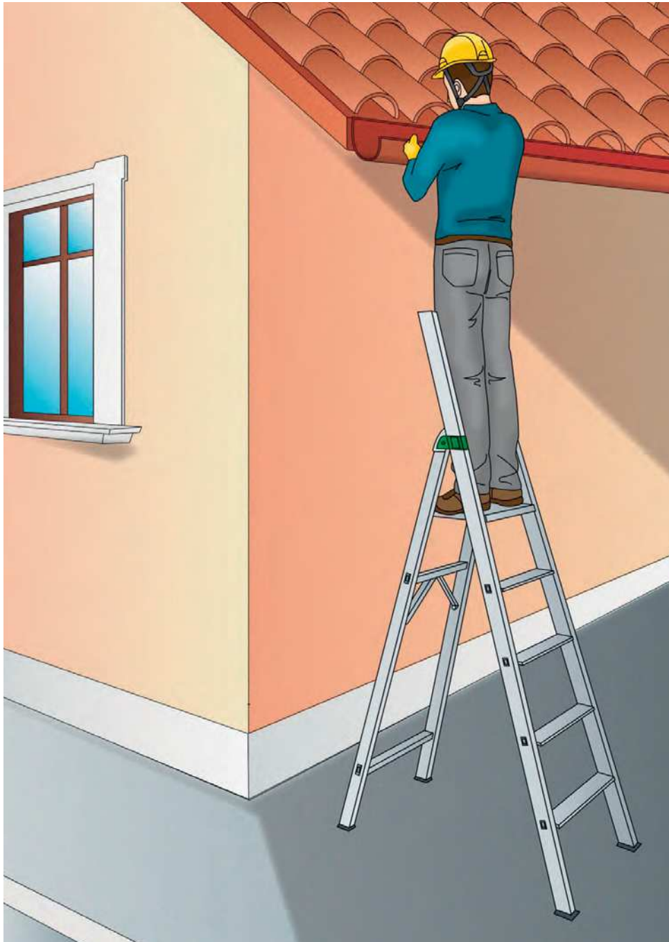
Figura 4 - Esempio di scala doppia